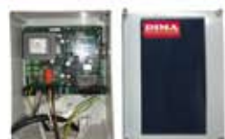
TABLEAU DE MANOEUVRES