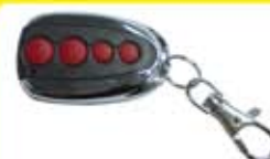
COMMANDE 4 CHAÎNES