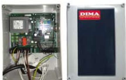
TABLEAU DE MANOEUVRES